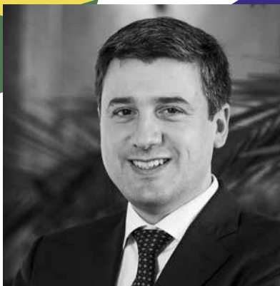
MATHIAS ZOPFI, STÄNDERAT GRÜNE GL

1 Die Schweiz hat das Potential, ihre internationale Wahrnehmung viel mehr einzusetzen. Die Schweiz muss als kleiner Rechtsstaat auf die Einhaltung des Rechts pochen. Dazu gehört auch, dass die Menschenrechte eingehalten werden. Eine aktivere Rolle würde uns gut anstehen.