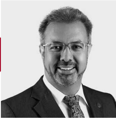
NIK GUGGER, NATIONALRAT EVP ZH, CO-PRÄSIDENT PARL. GRUPPE TIBET

1 Es ist absolut wichtig, dass das Thema Menschenrechte immer wieder auf den Tisch kommt und sich die Schweiz aktiv dafür einsetzt. Die Schweiz unterstützt zum Beispiel eine Erklärung des UN-Menschenrechtsrates, in der die chinesischen Behörden aufgefordert werden, ihre Menschenrechtsverpflichtungen einzuhalten. Solche Erklärungen, auch gemeinsam mit andern Staaten, müssen unbedingt auch weiterhin an die Adresse der VR China gerichtet werden.