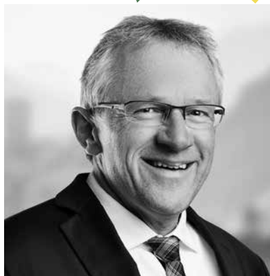
BENJAMIN ROUIT, CONSEILLER NATIONAL CENTRE VS

1 Il s'agit de réaffirmer sans cesse le droit à l'autodétermination du Tibet, en particulier dans chacune de nos rencontres officielles avec des représentants de la RPC.