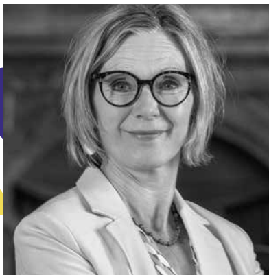
MAYA GRAF, STÄNDERÄTIN GRÜNE BL, VIZEPRÄSIDENTIN PARL. GRUPPE TIBET

1 Die offizielle Schweiz kuscht vor China, obwohl sie in ihrer neuen Rolle als Mitglied des UN-Sicherheitsrates die Menschenrechte, die Religions- und Meinungsfreiheit gezielt verteidigen könnte. Deshalb erwarte ich ein Vorgehenskonzept des Bundesrates, etwa in dem Bericht aufgrund des Postulates 20.4333 der Aussenpolitischen Kommission des Nationalrates. Der Bundesrat sollte konkret erklären, wie er die Meinungsäusserungsfreiheit der Tibeterinnen und Tibeter gewährleisten und sie vor Überwachung durch die chinesische Regierung in der Schweiz schützen kann. In unserem Land lebt eine der grössten Diaspora-Gemeinschaften Tibets. Die Exiltibeter:innen sind stark betroffen von zunehmenden Spionageaktivitäten Chinas auf Schweizer Boden. Der Bundesrat hat mir auf meine Interpellation «Nationale Daten, Kriterien und Leitlinien zu Hochschulkooperationen und akademischen Austauschprogrammen mit der Volksrepublik China» sehr unzureichend geantwortet. Deutschland etwa ist bei koordinierten Präventionsmassnahmen zum Schutz von Lehre und Forschung deutlich weiter. Ich werde die Entwicklung weiterhin kritisch verfolgen.