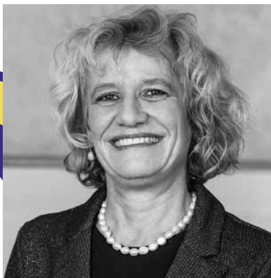
KATHARINA PRELICZ-HUBER, NATIONALRÄTIN GRÜNE ZH

1 Die Schweiz muss die Menschenrechtsverletzungen im Tibet aktiv verurteilen und die Volksrepublik China dazu auffordern, ihre Ein- und Angriffe gegen das tibetische Volk und seine Region zu stoppen. Zudem soll die Schweiz ihre Verpflichtung gegenüber der Allgemeinen Erklärung der Menschenrechte wahrnehmen und in Gesprächen mit China die Menschenrechtssituation aktiv und ungeschönt ansprechen. Dies insbesondere im Rahmen ihres Sitzes im UNO-Sicherheitsrats.