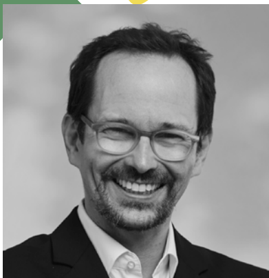
BALTHASAR GLÄTTLI, NATIONALRAT GRÜNE ZH, PARTEIPRÄSIDENT GRÜNE SCHWEIZ

1 Wir setzen uns als Grüne hinter und vor den Kulissen dafür ein, dass die Schweiz ihre Zeit als nicht-ständiges Mitglied im Sicherheitsrat dafür nutzt, die Menschenrechte stärker in den Fokus der UNO zu rücken. Dabei gilt es, die aktuellen Prioritäten zu ändern. Momentan scheinen gute wirtschaftliche Beziehungen mit der VR China (Freihandelsabkommen) wichtiger zu sein als die Verteidigung der Menschenrechte. Dass der Ansatz «Wandel durch Handel» nicht automatisch funktioniert, sehen wir ja aktuell am russischen Angriffskrieg gegen die Ukraine.