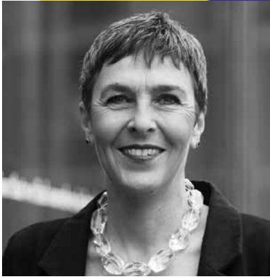
BARBARA GYSI, NATIONALRÄTIN SP SG

1 Die Menschenrechtslage in Tibet hat sich massiv verschlechtert und erfordert ein aktives Einbringen der Schweiz, damit die Menschenrechte eingehalten werden. Die Schweiz muss die Menschenrechtslage aktiv und regelmässig thematisieren und zwar in den direkten Kontakten, in wirtschaftlichen Zusammenhängen und in den internationalen Gremien.