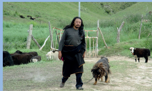
OLD DOG 2011