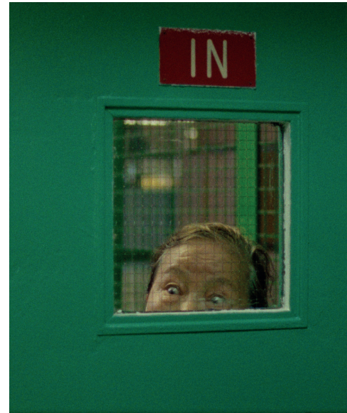
DHULPA, KUNSANG KYIRONG, 2022

Der Kurzfilm dreht sich um die tiefe Beziehung zwischen Mensch und Natur und den Wunsch, sich von Grenzen zu befreien. Trotz des herrschenden Einflusses geopolitischer Umstände auf unser Leben bleibt unsere Verbindung zur Natur eine unachgiebige Quelle, die Grenzen überwindet und uns zu einer selbstbestimmten Handlungsfähigkeit ermutigt. Die Inspiration für diesen Film stammt aus den Erfahrungen von Flüchtlingen und Exilanten, insbesondere von in Tibet geborenen Tibetern:innen, die sich in der Diaspora befinden, weit weg von ihren Familien und dem Land, in dem sie ihre ersten Schritte gemacht haben. Dort, wo sie so viele Erinnerungen haben und ihre frühesten Verbindungen zur Natur hergestellt haben.