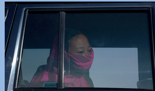
THE SEARCH (SOUL SEARCHING) 2009