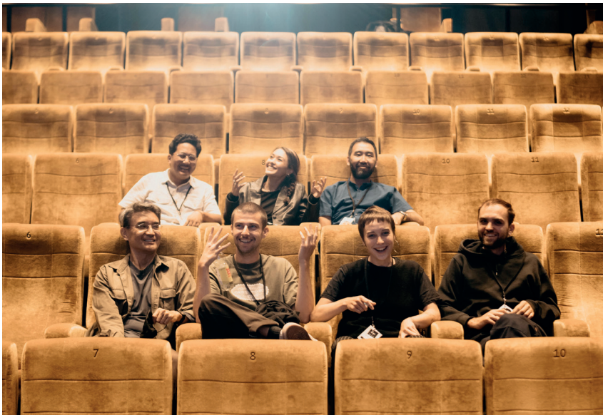
OK-TEAM TIBET FILM FESTIVAL