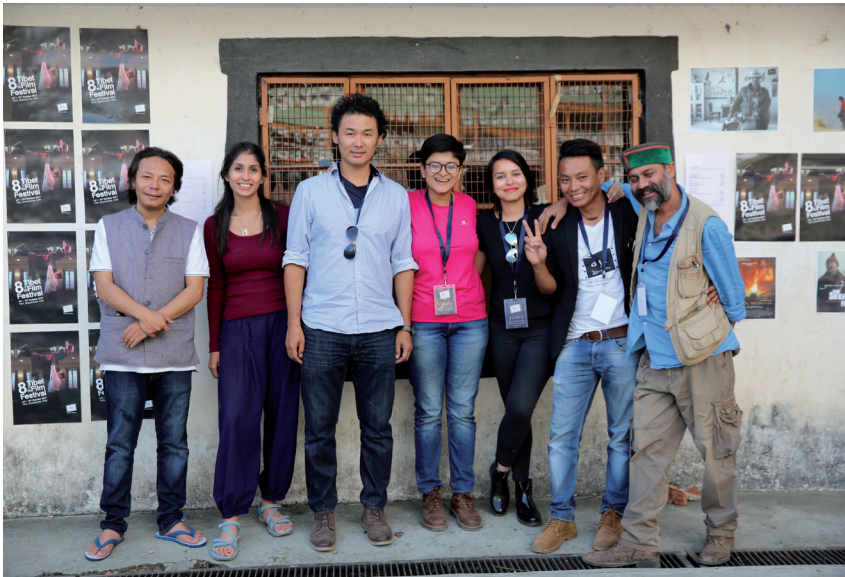
OK-TEAM IN DHARAMSALA