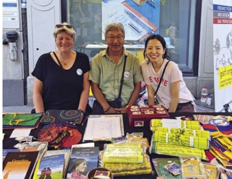
Section Suisse orientale