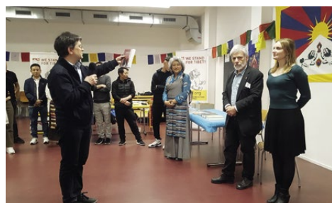
L'assemblée générale 2023 en terre romande