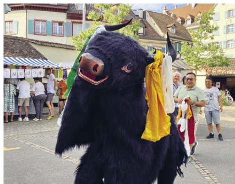
Fête du Tibet au Lindenberg de la section Suisse du Nord-Ouest