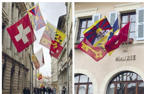
Le drapeau tibétain arboré à Genève et à Plan-les-Ouates