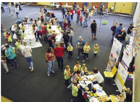
Journée Globi pour les enfants à Lenzerheide