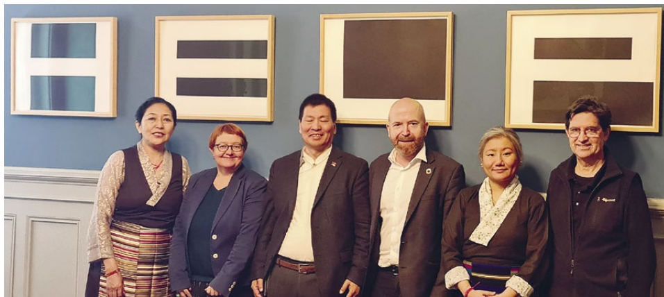
Rencontre à Berne avec des membres du Groupe Parlementaire Tibet

En plus des points forts décrits, deux situations difficiles se sont produites cette année, mettant à l'épreuve les compétences en communication de notre organisation. A la différence de nos organisations partenaires tibétaines en Suisse, la SAST, de par sa base de membres et à son orientation vers le public suisse, est toujours soucieuse d'élargir la compréhension des évé-