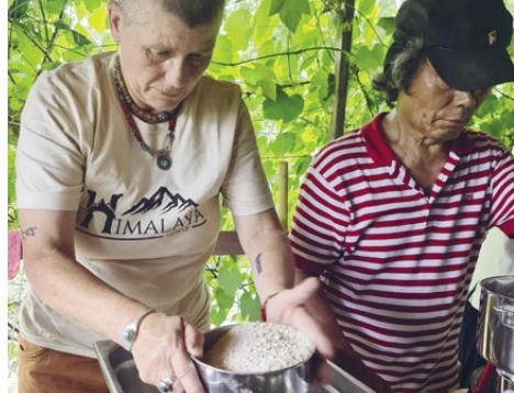
Section Suisse centrale