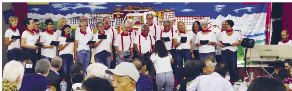
Section Zurich: les midlife cryers se produisent lors de la fête des 40 ans.