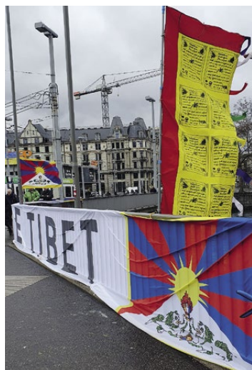
Action drapeau Zurich

En plus de publier le bulletin bimestriel de