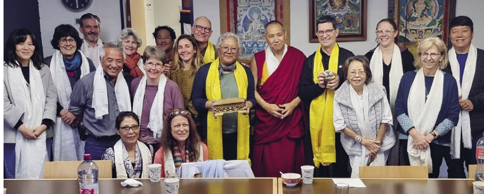
Rencontre semestrielle des responsables des sections et du comité au Tibet-Institut de Rikon