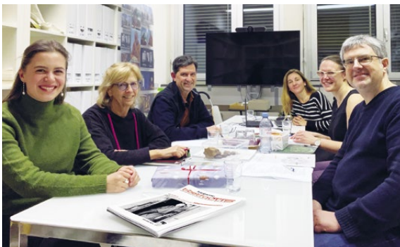
L'équipe rédactionnelle du magazine tibetfocus