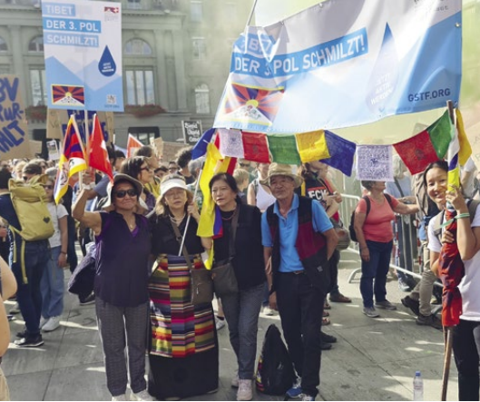
La fonte du 3e pôle au Tibet présente à la manifestation nationale sur le climat

naire très engagée lors des réunions du comité en arrière-plan en ligne.