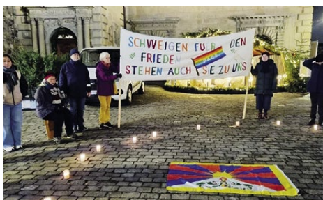
Section Suisse centrale: Silence pour la paix