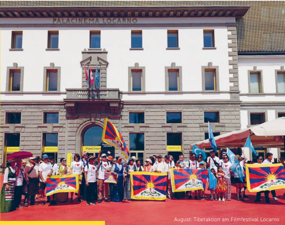
August: Tibetaktion am Filmfestival Locarno

སྤྱི་འདྲེན་མཐུན་ཁྲིལ་སྡེ་གསུམ་ལ། société d'amitié suisse-tibétaine gesellschaft schweizerisch- tibetische freundschaft gstf sast