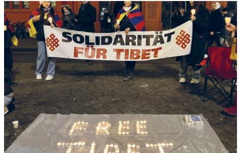
Sektion Nordwestschweiz: Mahnwache