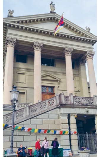
Sektion Zürich: Stadthaus Winterthur

Am 20. und 21. April war das Tibet Museum zu Gast im Kirchgemeindehaus Aussersihl. Bei dem Anlass wurde auch an die über