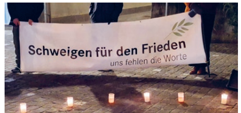
Sektion Zentralschweiz: Veranstaltung mit Kelsang Gyaltzen und «Schweigen für den Frieden»