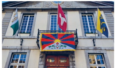
Sektion Romandie: Beflaggtes Rathaus Vevey