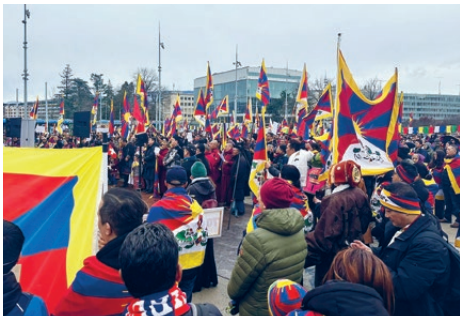
Sektion Romandie: Demonstration am 10.3. in Genf