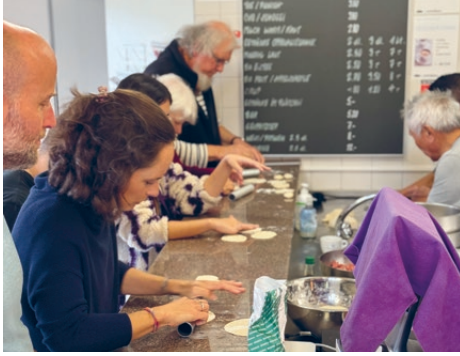
Sektion Mittelland: Momo-Kochkurs