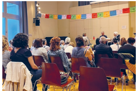
Sektion Romandie: Yverdon Podiumsdiskussion