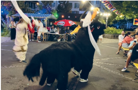
Sektion Nordwestschweiz: Tibetfest am Lindenberg